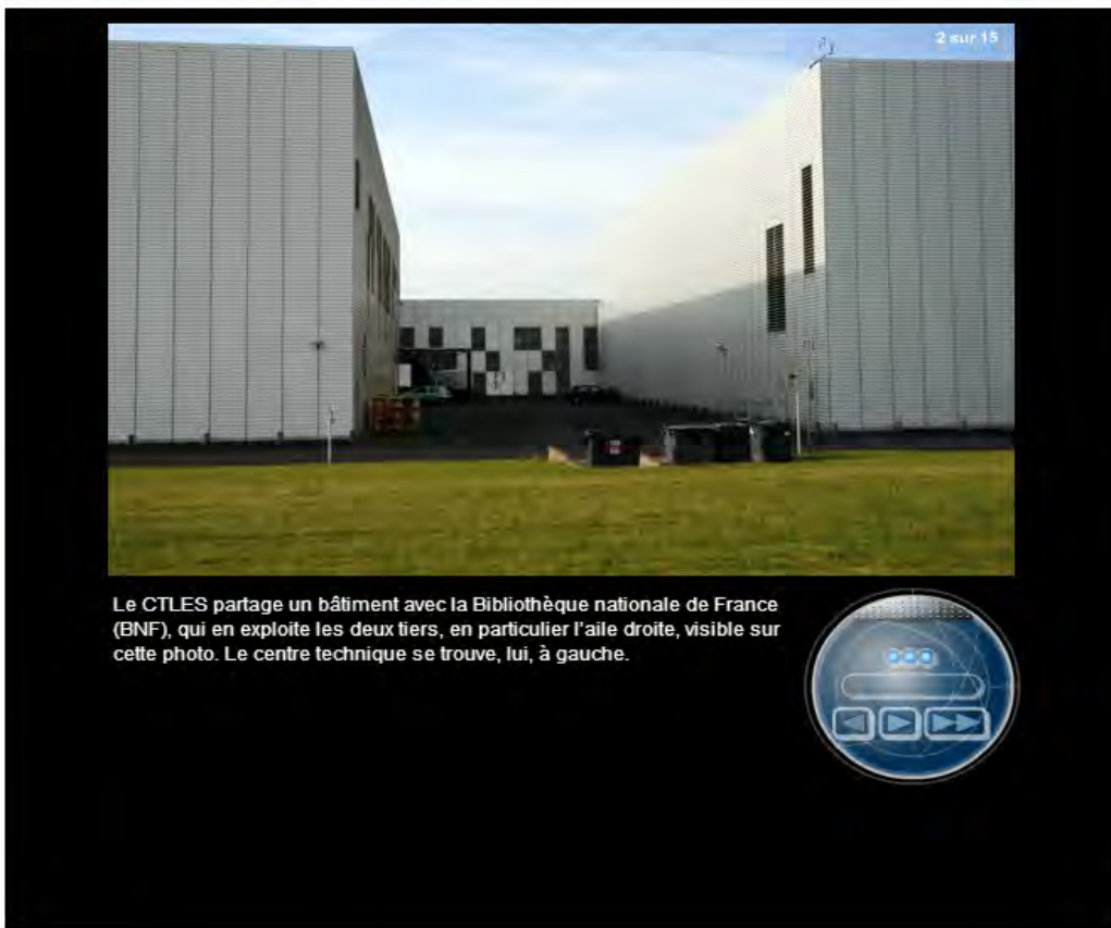
Le CTLES partage un bâtiment avec la Bibliothèque nationale de France (BNF), qui en exploite les deux tiers, en particulier l'aile droite, visible sur cette photo. Le centre technique se trouve, lui, à gauche.

Rares sont les connaisseurs de l'enseignement supérieur français qui songeraient à s'arrêter à Bussy-Saint-Georges (Val-de-Marne). Là où se trouve pourtant le Centre technique du livre de l'enseignement supérieur. Découverte en photos de cette institution.